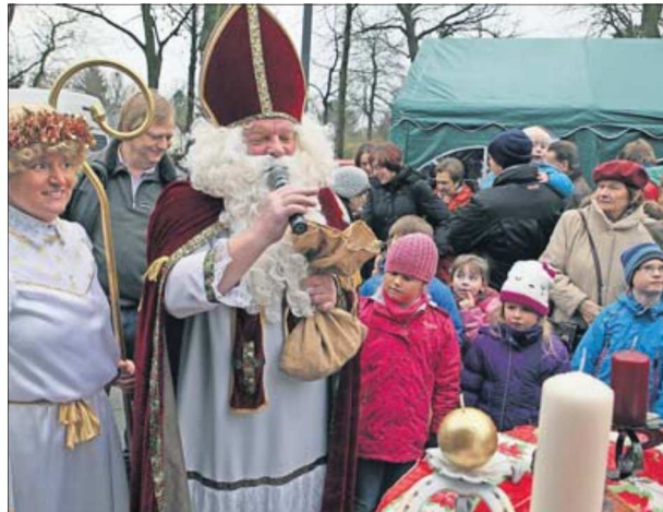
Der Nikolaus und seine Engel werden dem Weihnachtsmarkt auch einen Besuch abstatten und haben wieder reichlich Geschenke im Gepäck.