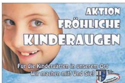
Fröhliche Kinderaugen lassen Herzen hüpfen! Was gibt es Schöneres, als Jungen und Mädchen, denen es gut geht.