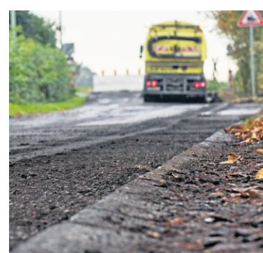
Neuer Asphalt für die Hochheider Straße.

Jetzt meldet sich erneut ein verärgertes Anwohner. Denn schon wieder wurde eine andere Straße im Umfeld saniert, während die Winkelhauser Straße weiter in der Warteschleife hängt. Diesmal war es die Hochheider Straße, die wie berichtet ausgebessert wurde. „Die Straße mündet dort in einen Feldweg und