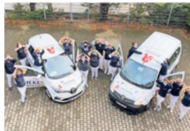
Das Team der Apotheke am Geistfeld

Ganze vier Mal am Tag ist mittlerweile der Lieferservice der Apotheke am Geistfeld unterwegs, um vorbestellte Medikamente und Heilmittel an diejenigen auszuliefern, die derzeit die Apotheke am Geistfeld nicht persönlich aufsuchen können oder wollen. Unter www.geistfeld.de hat die