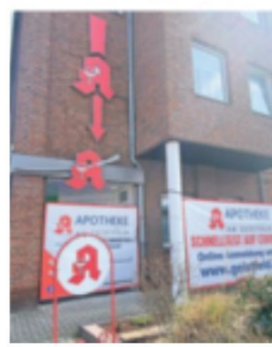
Sicht- und windgeschützt: der Eingang zur Apotheke am Geistfeld