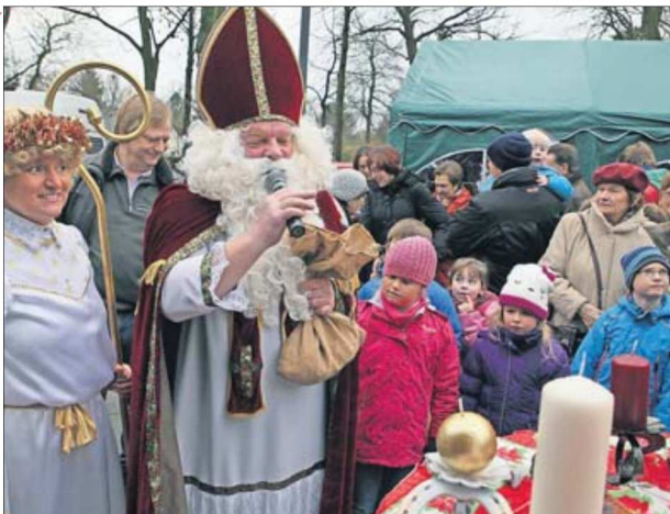
Der Nikolaus und seine Engel werden dem Weihnachtsmarkt auch einen Besuch abstatten und haben wieder reichlich Geschenke im Gepäck.