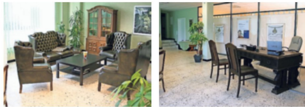
Das Bestattungsunternehmen Oliver Grote an der Himbergstraße 2 in Rumeln.