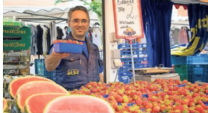
Die Marktbesucher und Duisburg Kontor bitten um Verständnis aufgrund der Terminänderungen.