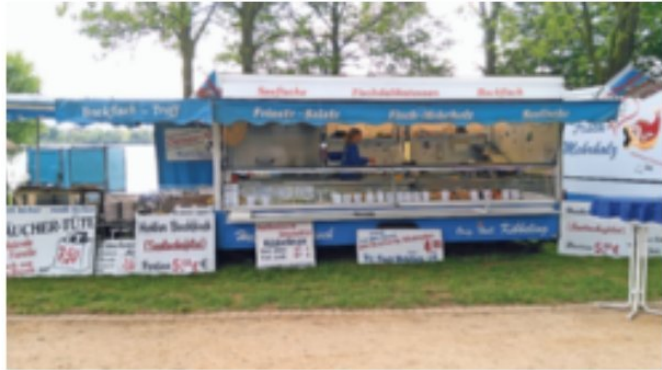
Geräuchert, gebacken, mariniert oder pur - am Verkaufswagen von Müller-Mehrholz bekommt man die ganze Fisch-Vielfalt.