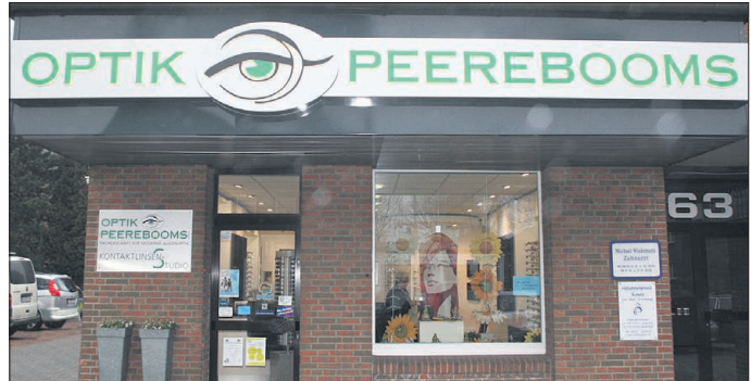
Bei Optik Peerebooms wird sehr viel Wert auf kompetente Beratung und optimalen Service gelegt.

Familie Peerebooms & Team: „Denken Sie an unser 30-jähriges Jubiläum - wir werden viele Überraschungen für Sie bereit halten!“